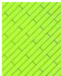
cassero regolare in diagonale

Gli schemi di posa sono molteplici, qui vi proponiamo solo alcuni esempi: