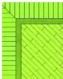
cassero regolare in diagonale con fascia