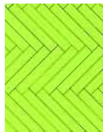
spina di pesce